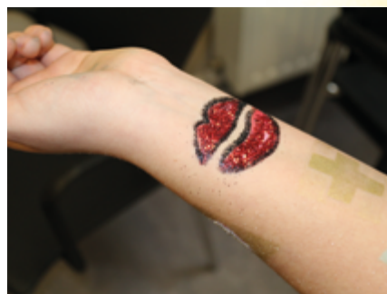
↑ Art tribal : une histoire de tattoo