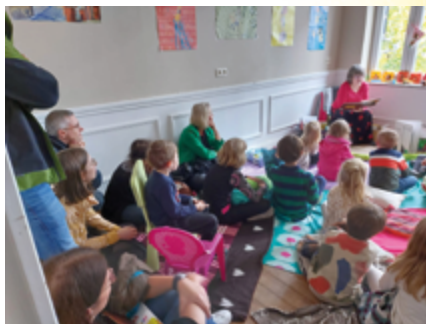
↑ Heure du conte autour du livre