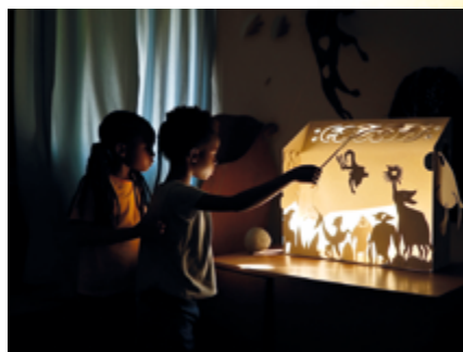
↑ Découverte et initiation au théâtre d'ombres