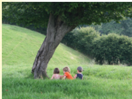
↑ Mon ami l'arbre