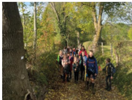
↑ Promenons-nous dans les bois !