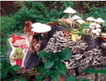
↑ La balade des lutins