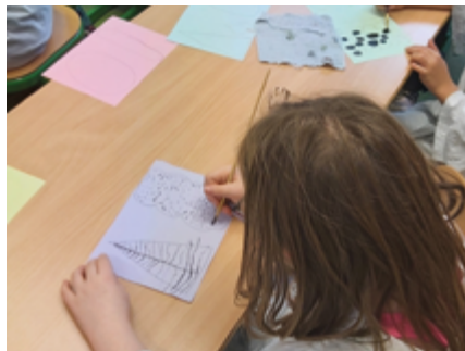
↑ Illustration à l'encre de Chine