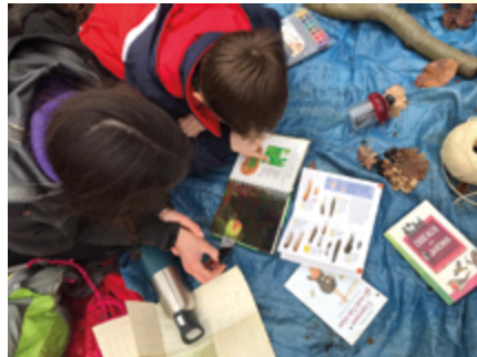
↑ Bain de forêt