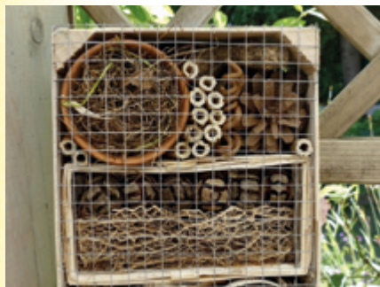
↑ Création d'un hôtel à insectes artisanal