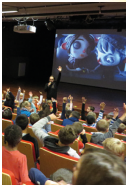
↑ Ciné-club à la carte