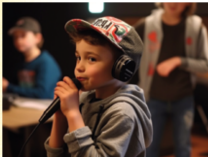
↑ Hip-hop, beatbox et sampling