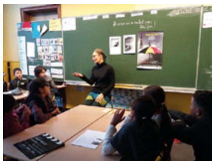
↑ Auteurs en classe