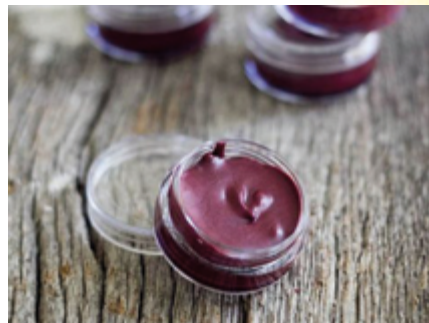
↑ Création d'un baume à lèvres personnalisé