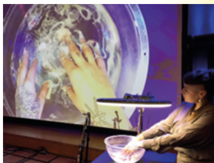
↑ Immersion dans les arts plastiques et visuels