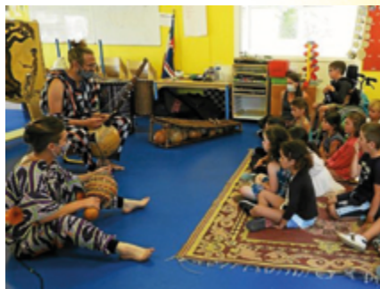
↑ Percussions africaines