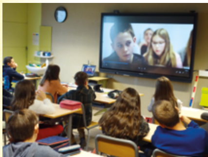
↑ Prévention du cyberharcèlement par le cinéma

AFIN D'APPORTER un soutien aux professionnels de l'éducation désireux d'entamer un travail de prévention avec les jeunes en regard de la problématique du (cyber)harcèlement, Loupiote a développé deux modules d'animation de 100 minutes pour des enfants de 8 à 12 ans. Ces animations sont basées sur la projection d'extraits vidéo, et rythmées par des jeux, activités, méthodes, exercices... variés et adaptés aux enfants du primaire. Si ces deux modules sont pertinents séparément, ils ont été pensés dans une suite logique et peuvent donc s'enchaîner.