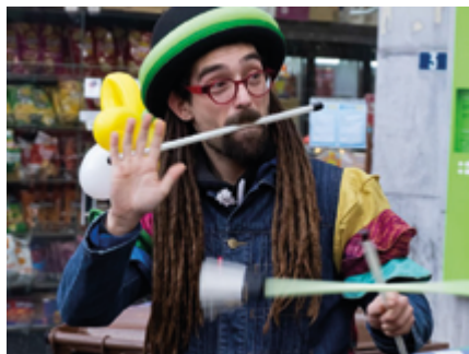
↑ Les allumé·es font du cirque !