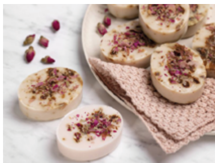
↑ Création d'un savon personnalisé