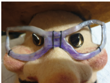
↑ Qui es-tu, marionnette ?