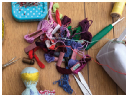
↑ Création textile