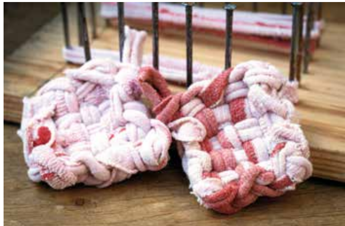
La technique du Tawashi permet de confectionner des éponges en tissu.

– Deux méthodes japonaises : le Tawashi et le Furoshiki. Avec la première, on prend une chaussette solitaire et on la découpe afin d'en faire une éponge en tissant les bandelettes. La seconde