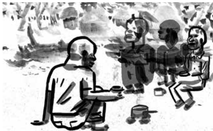
Des mondes lointains a reçu le Prix du « meilleur documentaire dessiné ».

Des mondes lointains est né des voyages entrepris par