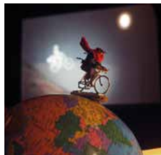
Atour du monde avec Grand-mère

Une chouette journée d'apprentissage et de perfectionnement de la guitare d'accompagnement, pour les novices comme pour les plus aguerris ! Réparti-es en groupes selon votre niveau et encadré-es par