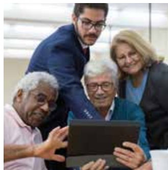
Se former au numérique au Cid