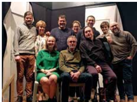
« Super Papy » avec Les Funambules