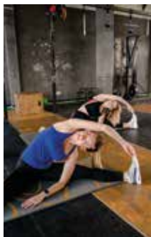
Gala à la Nationale