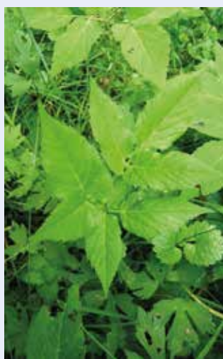
Aegopodium podagraria , l'égopode podagraire ou « herbe aux gouteux » est une plante herbacée sauvage qui appartient à la famille des Apiacées.

me demande ce que je vais faire de cela? Cela, c'est un magnifique morceau de fromage bien conservé au sec, si ce n'est qu'il a durci plusieurs jours dans le sachet. « Et oui », poursuit-elle, « j'avais omis de le placer au réfrigérateur ». Je lui réponds qu'avant qu'elle n'entre, je me posais justement la question de savoir ce que j'allais manger ce midi... et voilà! Le fromage à pâte dure est alors déposé dans un caquelon avec, au fond, un peu de lait et d'eau, une poignée de jeunes pousses de lamier blanc, de très petites feuilles d'égopode à peine déroulées et découpées en un fin hachis, ainsi qu'une pincée de piment rouge. Le couvercle fermé, il va s'amol-