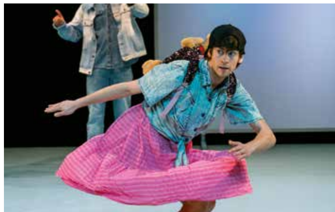
NORMAN, c'est comme normal...