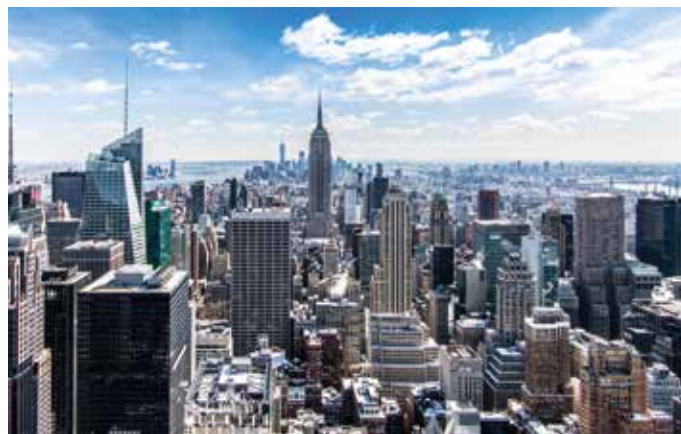
New-York, porte du Nouveau Monde.