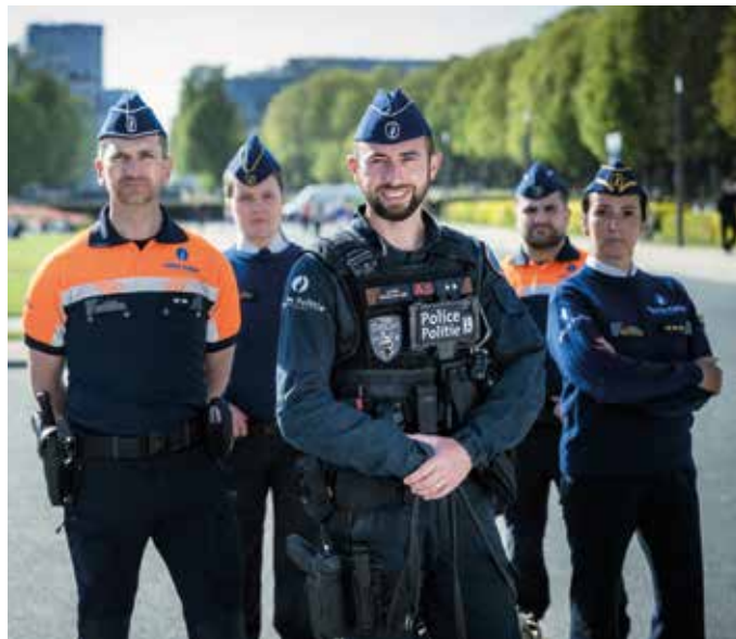
Envie de poser sur la photo en compagnie de vos futur(e)s collègues ? La police intégrée recrute !

Notre mission, en tant que policier, consiste à protéger les libertés individuelles et les droits fondamentaux et à contrôler le respect des règles afin de contribuer au maintien de la sécurité et de la démocratie au sein de notre société. Intégrité, respect et ouverture d'esprit sont par conséquent des valeurs que vous devrez pou-