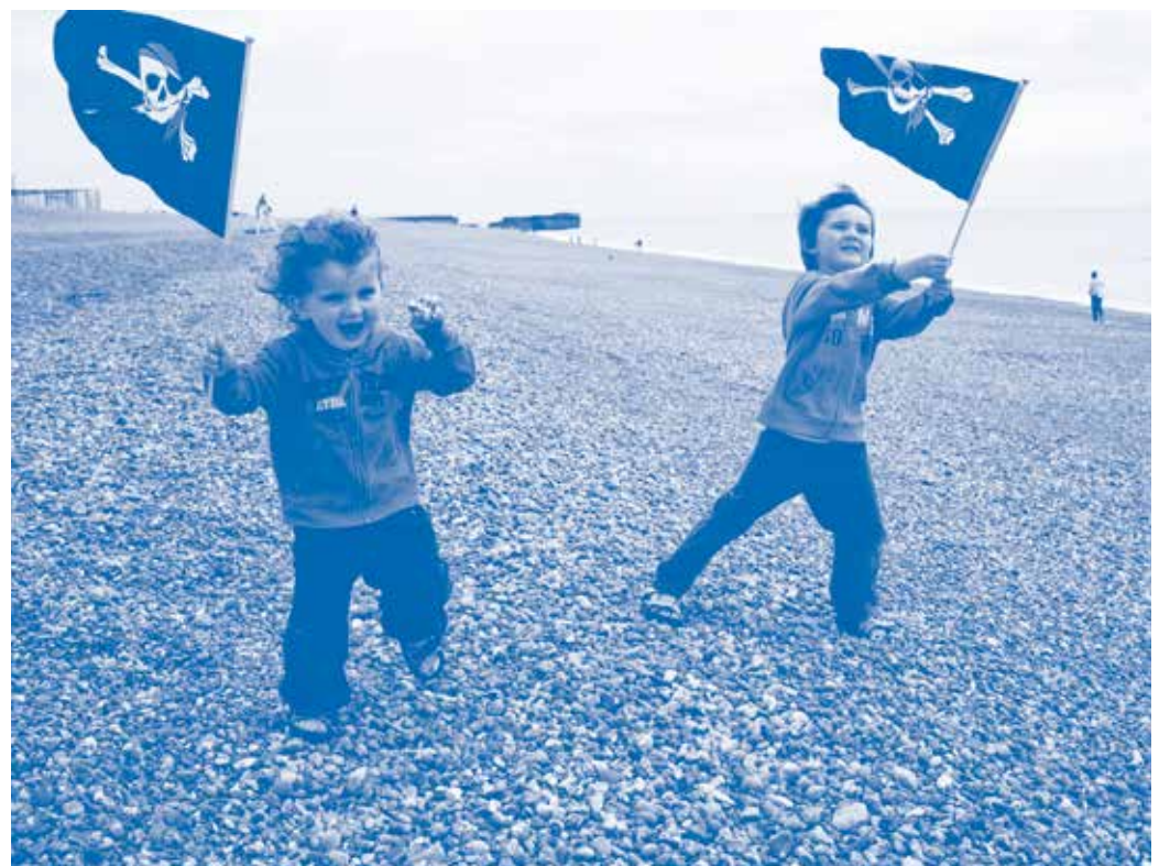
Se sentir un peu comme un pirate.