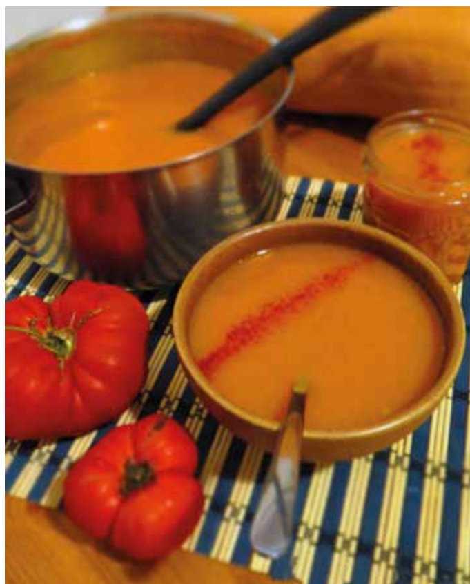
La soupe est servie à la Régie des quartiers!

C'est avec une grande joie et beaucoup de gratitude que la Régie des quartiers vous annonce la réouverture tant attendue de son cher bar à soupes dès le mercredi 7 février 2024! Après une longue période de fermeture, nous sommes prêts à vous accueillir à nouveau dans ce lieu chaleureux qui a bercé tant de moments conviviaux. Notre équipe est impatiente de vous retrouver et de vous accueillir comme il se doit. Retrouvons-nous autour d'un bol de soupe, de rires partagés et de moments inoubliables. Ensemble, redonnons vie à ce lieu qui a tant de belles histoires à raconter. «Ze Bar à Soupes» se déclina à l'avenir au rythme d'un mercredi sur deux, et ce à partir du mercredi 7 février 2024. Nos stagiaires vous accueilleront entre 11 h 30 et 13 h. Si vous désirez emporter votre soupe ou votre repas, merci d'apporter vos contenants. Il n'est pas nécessaire de réserver votre table, l'esprit de notre Régie étant le partage et la convi-