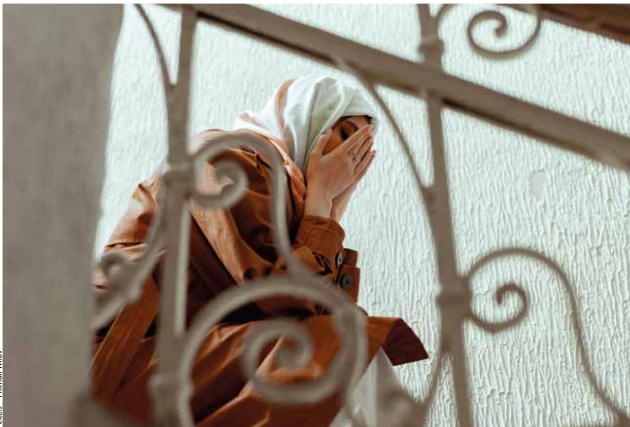
Photo: En région verriétoise notamment, on manque d'outils et de moyens pour répondre aux besoins spécifiques des personnes migrantes qui ont subi des violences dans leur pays d'origine ou durant leur parcours migratoire.