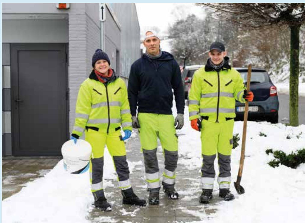
« Juste avant que vous arriviez, on a fait une petite bataille de boules de neige ! »