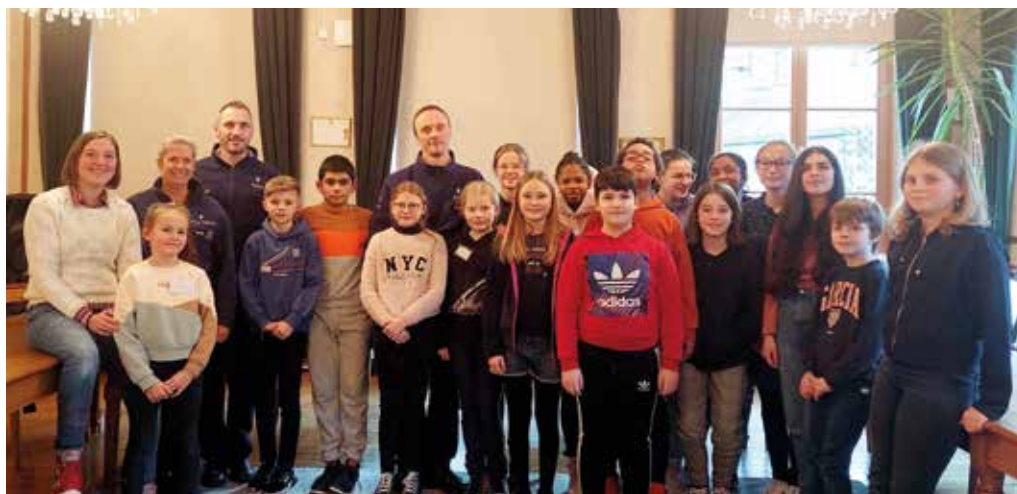
Photo « finish » à l'issue de la rencontre Police et Conseil communal des enfants

la vitesse des conducteurs. Les enfants ont ensuite tenté de trouver des solutions à cette vitesse trop élevée pour la zone : casse-vitesse, feux de signalisation ou encore amende d'un montant de... 10 000 euros pour les excès de vitesse ! À bon entendre...●